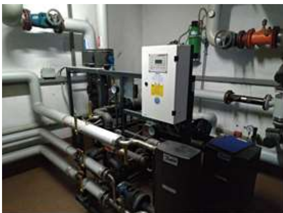
Fig. 3 - sottostazione 2AB: sistema scambiatori di calore per produzione acqua calda