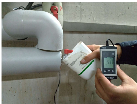
Fig 4 - sottostazione 2AB: rilevazione temperatura ricircolo acqua calda